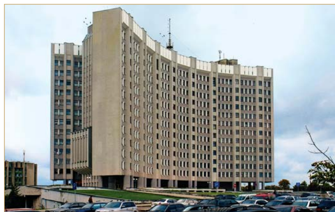
Львівська податкова адміністрація

Життєве кредо будівничого Каменщика: «ORA ET LABORA» («Молися і твори»).