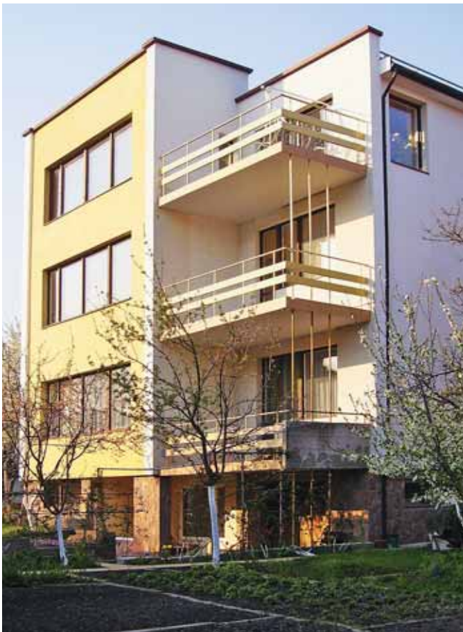
▲ Будинок по вул. Утіха, 16 (м. Львів), зведений за проектом Я. Ульгурського. 2008