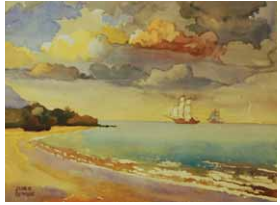
▲ Мрія мого дитинства. Акварель, 30x40. 1978