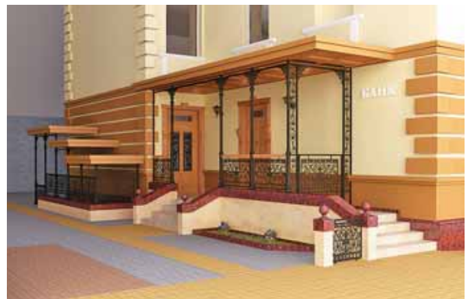
▲ Проект вхідної групи будинку (м. Бучач). 2007

У творчому доробку Я. Ульгурського — понад 60 робіт акварельного живопису, олійний, темперний станковий живопис (портрети, пейзажі, натюрморти); проекти експозиції музею Івана Франка у Львові, Історичного музею, Музею історії релігії та атеїзму, філіалу музею Леніна у Львові, Краєзнавчого музею м. Кременця; проекти індивідуальних житлових будинків у Львові по вул. Втіха, 16, на Копані, 2, на Мучній, 7 та в м. Мостиська; проекти та виконання великих люстр для будинків культури у Львові та смт Сахновщині, монументальні панно в техніці сграфіто на фасаді Палацу спорту в м. Буську Львівської області та на фасаді школи № 4 у м. Нововолинську; ікони митрополита А. Шептицького і священномученика Чарнецького та інші.