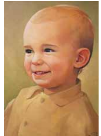
▲ Портрет дитини. Картон, полотно, олія, 30x50. 2004