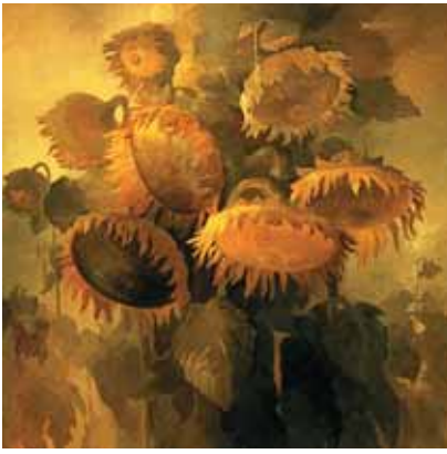
▲ Соняшники. Картон, полотно, темпера, 115x115. 1980