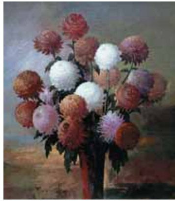
▲ Хризантеми. Картон, полотно, темпера, 100x115. 1980