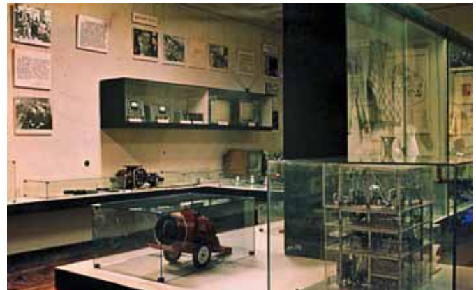
▲ Проект експозиції Львівського історичного музею. 1963