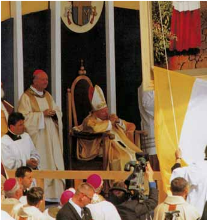
▲ Рання весна в Седневі. Картон, полотно, темпера, 50x70. 1984 ▲ Проект крісла для Папи Римського Івана-Павла II. 2001 ▶ Ікона митрополита Андрія Шептицького. Картон, полотно, олія, 71x175. 2008 ▶ Оформлення актового залу Будинку культури ЛОРТА. 1981