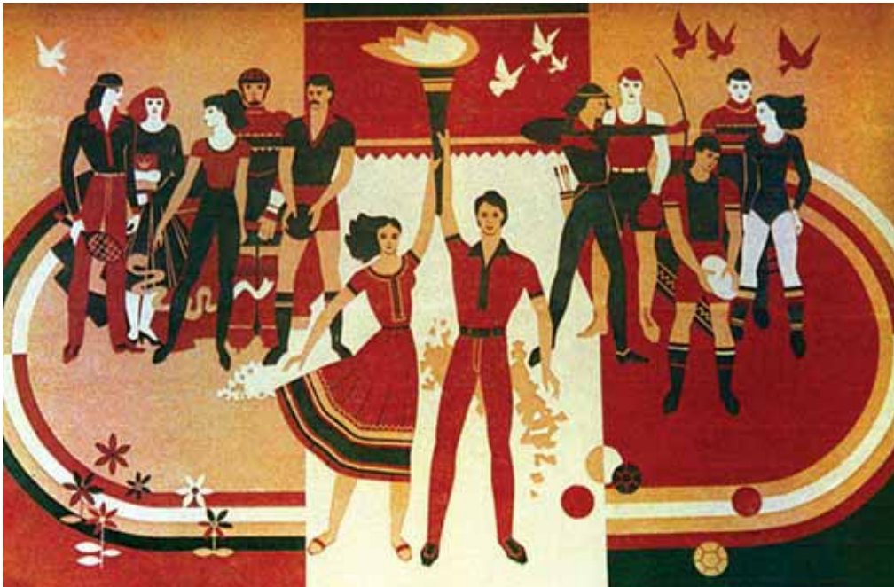
▲ Панно в техніці сграфіто на фасаді будинку Палацу спорту (м. Буськ). 1200x800. 1984

Доцент кафедри проектування інтер'єрів, приват-професор ЛНАМ. Відмінник освіти України