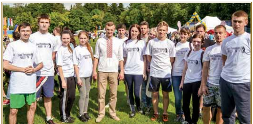
Студенти факультету землепорядкування — активні учасники святкування Дня університету, 2019 р.

Таким чином, діяльність усіх вищезазначених структур спрямована на формування студента факультету землепорядкування як людини, метою якої є всебічний розвиток, досягнення визначених цілей, ефективна самоорганізація та керівництво іншими, набуття високого професіоналізму.