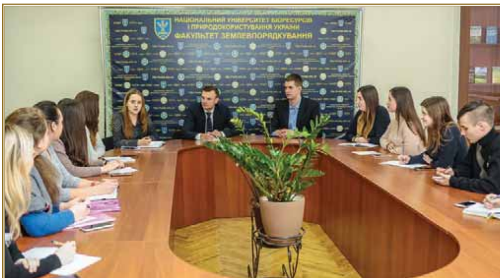
Засідання старостату, 2019 р.

Наступним кроком є набуття статусу студента. Це відбувається за день до початку