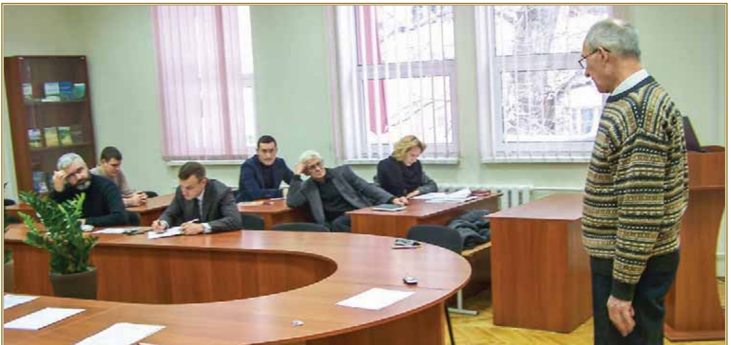
Звіт про хід виконання науково-дослідних робіт