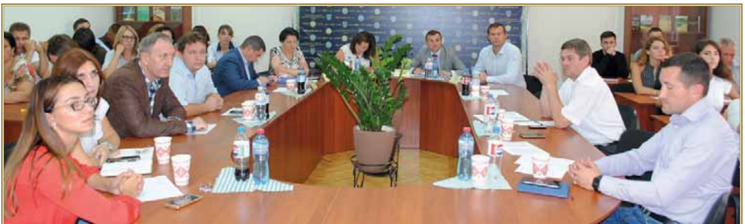
Засідання Вченої ради